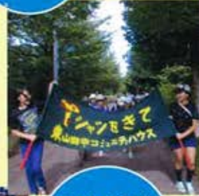
みんなが集まるところ