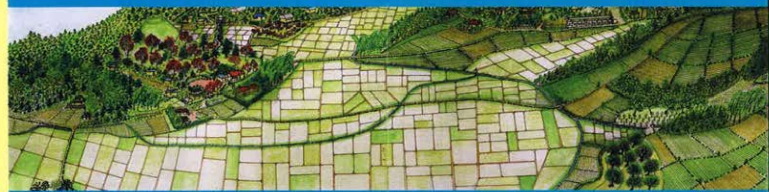
昭和40年代の街の様子 黒全宮城さん「望郷」より