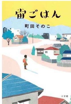
「宙ごはん」 町田そのこ