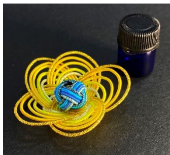
出来上がりサイズ：50mm×50mm×15mm