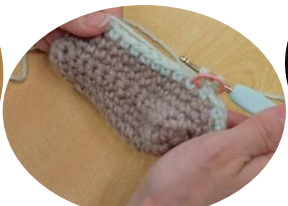
毛糸でポーチ作り