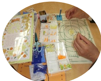
ペーパークイリング