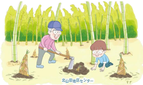
北山田地区センター