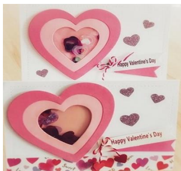
②キラキラバレンタインカード