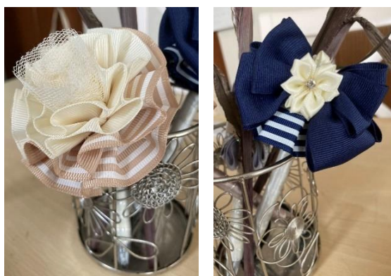
① ベージュリボン ②紺リボン （出来上がりは写真見本と異なる場合があります）