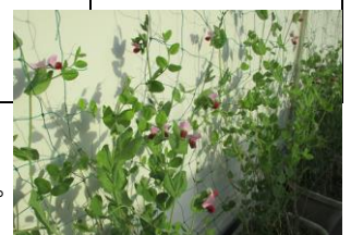
ツタンカーメンエンドウの花が咲きました。