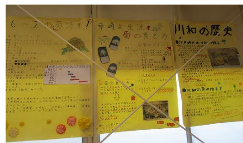
6年生が調べた川和の菊の掲示物

先日卒業した川和小学校6年生が、川和の菊について調べたそうで、模造紙にまとめたものを地域の方に見ていただきたいということで、コミハ玄関入ってすぐの廊下に掲示しました。菊の育て方や川和の菊の歴史や菊の花について、私は知らなかったことがよく調べてありまっています。しばらく掲示するつもりです。のでご来館の時にはぜひご覧ください。