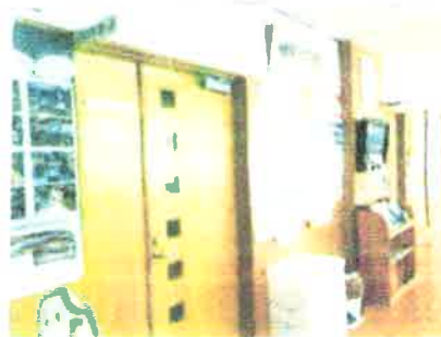
研修室までお気軽にどうぞ♪