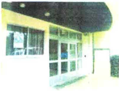
会場入り口（緑道添いにあります）

♪小高い丘にあり、目の前には大きな東山田公園を望む緑豊かな環境です ♪ゆったりとした会場で、0歳から就学前のお子さんまでおもちゃで 楽しく遊んだり、本を読んだり、おしゃべりしたり、楽しく過ごせます