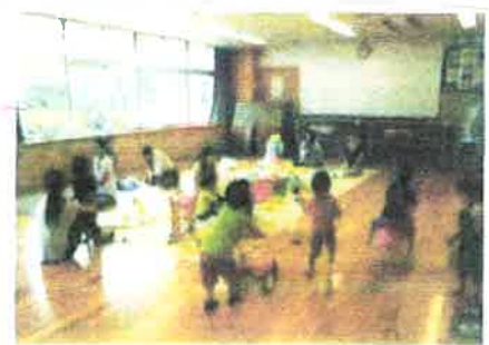
会場内の様子(いつも和やかです!)