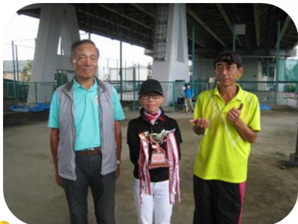
＜優勝したボヌール月の皆さん＞