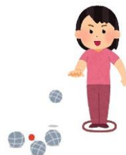
令和元年度 第18回東山田スポーツ会館親善ペタンク大会 令和元年10月6日