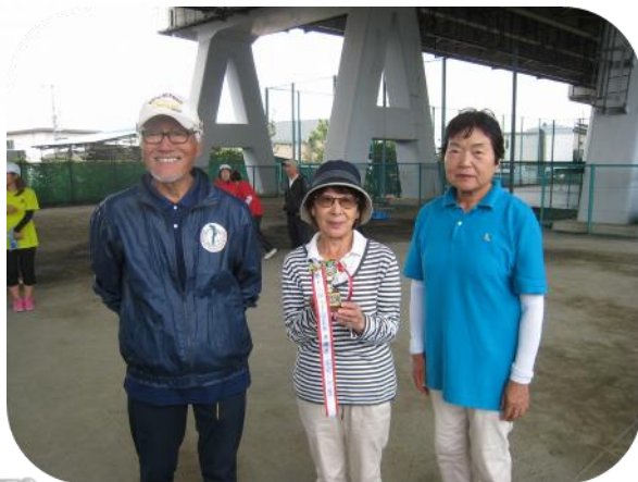
＜準優勝したボヌール星の皆さん＞