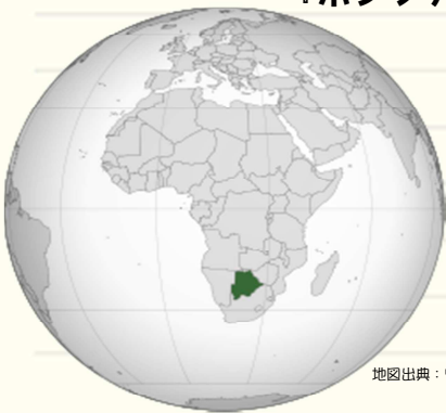
地図出典: ウィキペディア