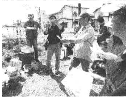
4/23 野草の説明を聞く参加者

春先の花が終わり、園路沿いにはコスモスの種まきが始まりました。更にコスモス畑は拡大し、7月頃から花が咲く予定です。それに先立ち、5月は赤いヒナゲシ、6月は黄色のキリンソウが咲きます。お楽しみください。