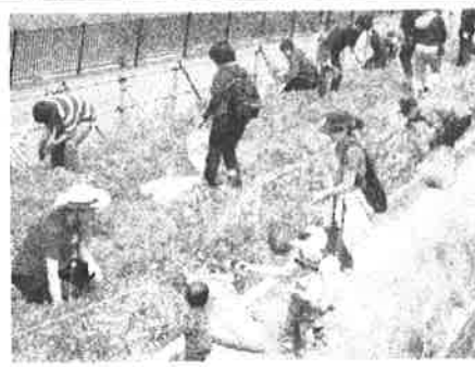
4/23 親子連れも花束用の花摘み