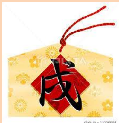
和風のクッキー生地