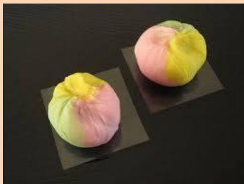
ピンク・白・緑の3色の蒸し饅頭